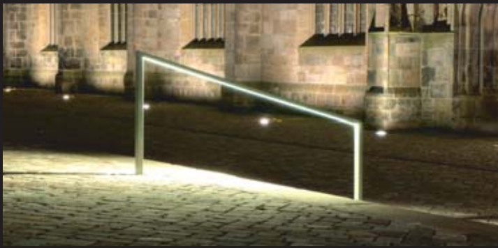
Abb. links: LED Handlauf mit Profil 110x40 mm

Die Entwicklung und Produktion findet bei uns statt.