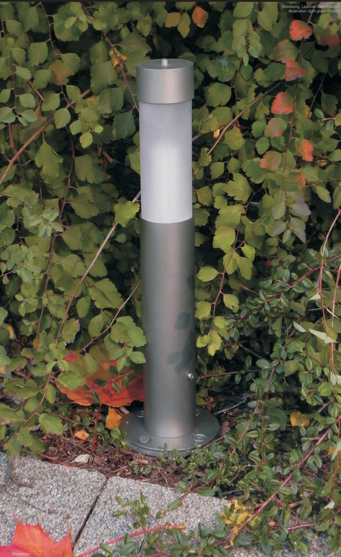
Abbildung: Leuchte Glas mattiert illustration: light glass frosted